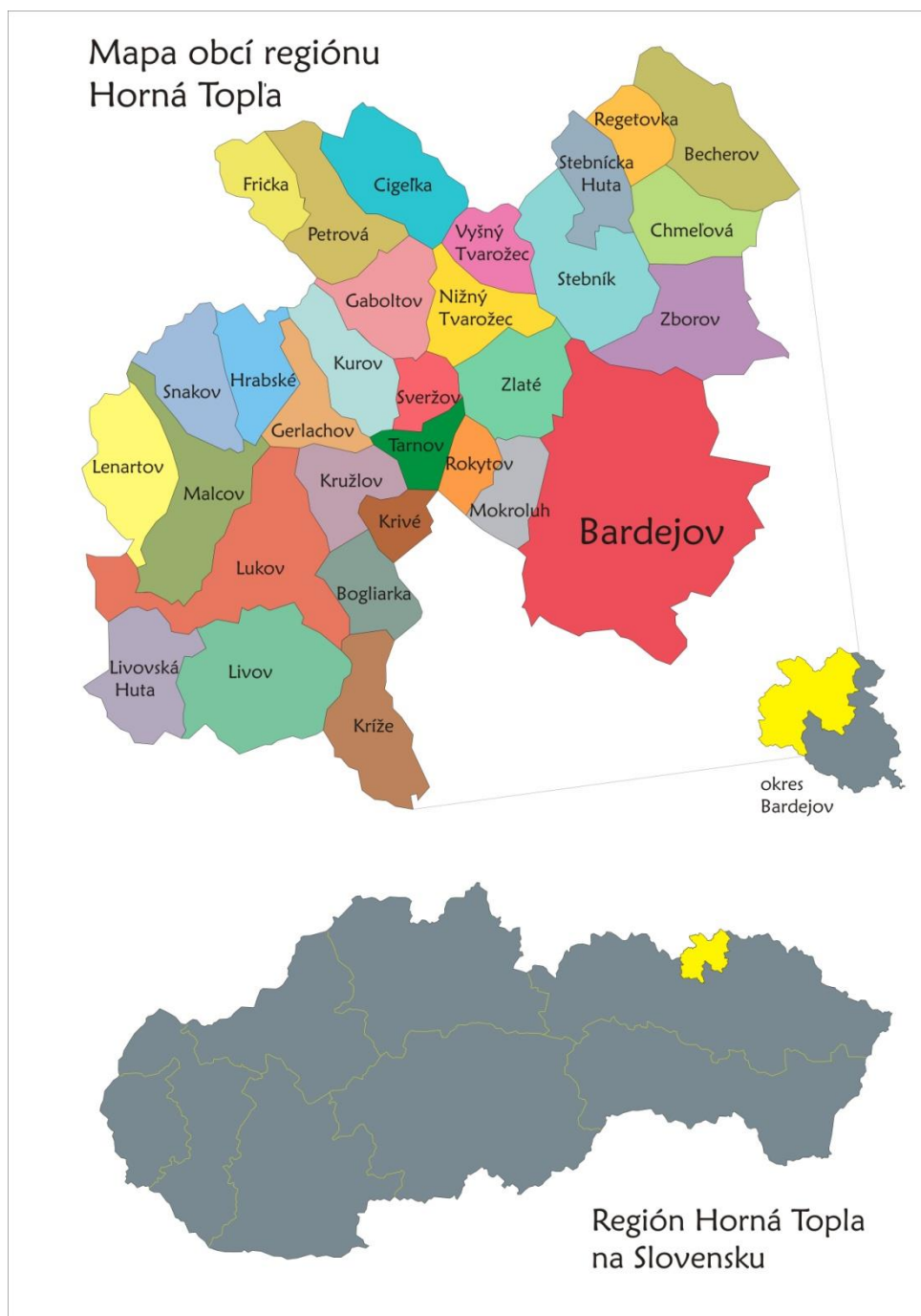
Obr. 2 Mapa mikroregiónu Horná Topľa